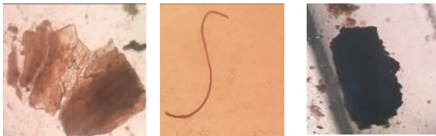
Gambar 2. Mikroplastik yang ditemukan dalam lambung ikan kapiek; (a) Film, (b) Fiber, (c) Fragmen

film yang tipis dan transparan memiliki bentuk yang menyerupai makanan alami ikan di perairan seperti fitoplankton sehingga lebih meningkatkan potensi ketertarikan ikan untuk memakan mikroplastik tipe film. Hal ini sesuai dengan Foley et al. (2018) yang menyatakan bentuk mikroplastik termasuk salah satu faktor yang memengaruhi potensi mikroplastik tersebut termakan oleh ikan.